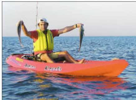
Las aguas tienen que estar quietas para la buena pesca.

Este deporte la lleva en Argentina y de a poco llega a Chile