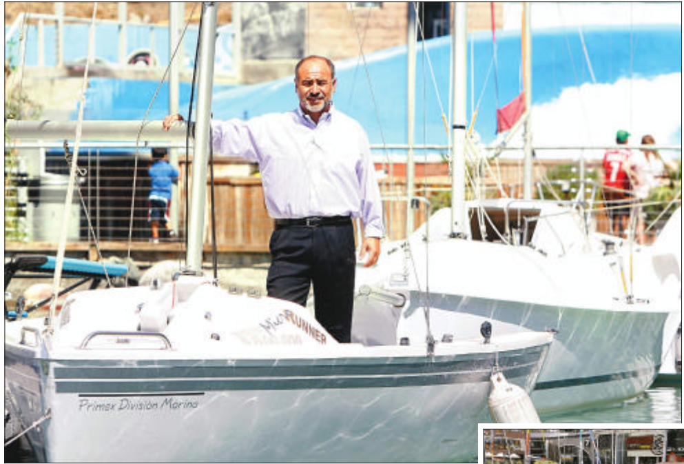
Paredes lleva el timón de esta tienda.

-Las lanchas sin lugar a dudas. A motor, como para la recreación familiar.